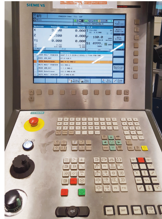
Aufgerüstet: alte Siemenssteuerung für die Nutzung maschineninterner Signale