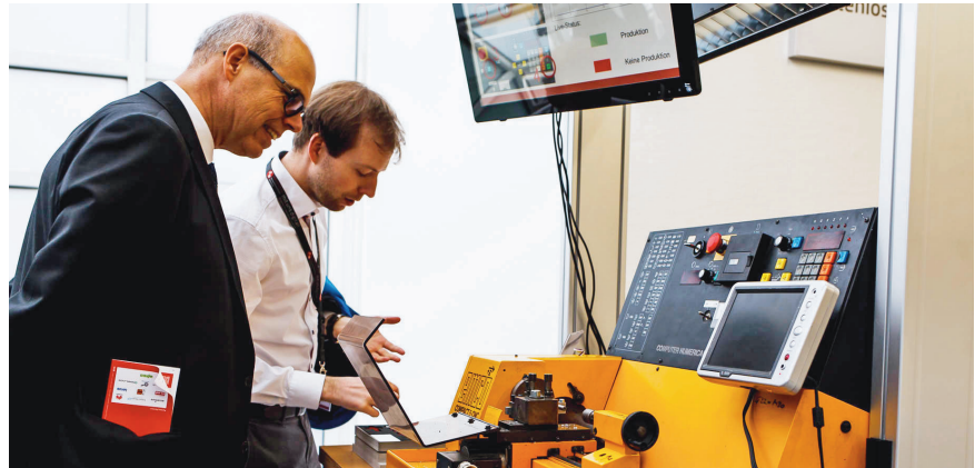
Beispiel in der Generalfabrik des Mittelstand 4.0-Kompetenzzentrums Hannover: digital eingebundene 35 Jahre alte Drehmaschine

Es gibt jedoch auch kostengünstige Lösungen für die Digitalisierung. Unternehmen mit älteren Maschinen und Anlagen müssen dafür nicht ihren Maschinenpark ersetzen. Digitalisierung kann auf Basis bestehender Maschinen und Anlagen erfolgen. Eine Möglichkeit, diese Maschinen in ein Fertigungssteuerungssystem zu integrieren, ist die nachträgliche Ausstattung der Maschine oder Anlage mit neuer Sensorik sowie geeigneter Kommunikationstechnologien. Dies nennt man Retrofit oder die digitale Aufrüstung von Maschinen.