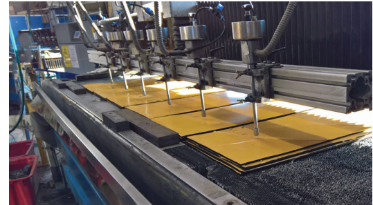
Wasserstrahlanlage zur Herstellung von Gummidichtungen

Die zunehmende Individualisierung von Produkten stellt nicht nur immer neue Anforderungen an die eigentlichen Maschinen, sondern auch immer komplexere Anforderungen an die Produktionsplanung und -steuerung. Somit kommen neben den „klassischen“ Gründen für eine Aufrüstung bestehender Maschinen vermehrt auch neue Anforderungen im Rahmen der Digitalisierung auf. Zu diesen gehört unter anderem das Erweitern der Maschinen um neue digitale Erfassungs- und Überwachungsfunktionen.