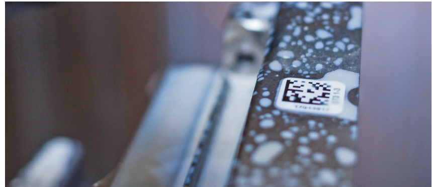
Bauteilmarkierung für automatische Programmwahl

Bei einer hohen Variantenvielfalt, wie sie etwa bei einer Fertigung in Losgröße 1 entsteht, müssen zahlreiche Programme nacheinander aufgerufen werden. Die händische Programmwahl bedeutet nicht nur einen erhöhten Aufwand für die Mitarbeiter, auch die Fehleranfälligkeit steigt in zunehmendem Maße.